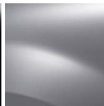
GRIS PLATINE (D69)