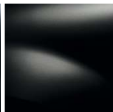
NOIR NACRÉ (676)