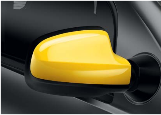
Coques de rétroviseur jaune impérial