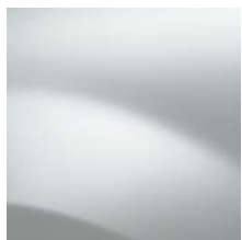
BLANC GLACIER (369)