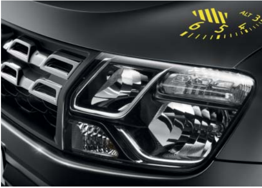
Striping altimètre sur capot