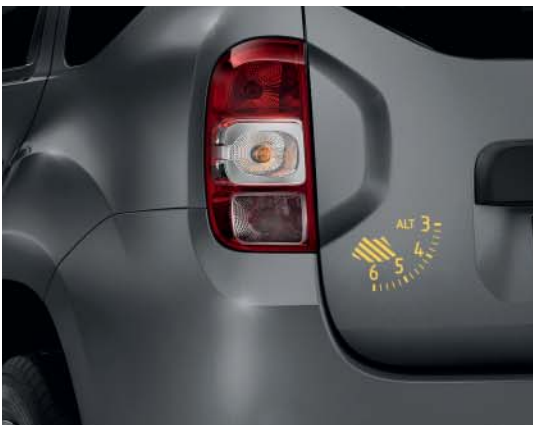
Striping altimètre sur hayon