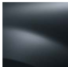
GRIS COMÈTE (KNA)